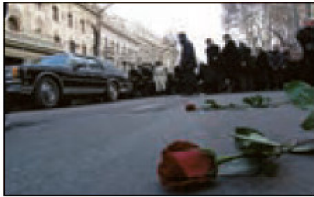
■ انقلاب گل سرخ در گرجستان

۲- انقلاب‌هایی که با استفاده از قدرت نرم رسانه‌ها درصدد براندازی حکومت‌های مخالف غرب برآمدند، انقلاب‌های رنگین نام گرفتند. در مورد این انقلاب‌ها و همچنین نحوه‌ی استفاده از شبکه‌های اجتماعی با هدف براندازی یک حکومت و شکل دادن به انقلاب‌های رنگین گفت‌وگو کنید.