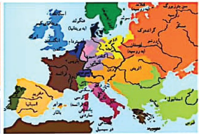
اروپا در ۱۸۵۰

تفاوت‌های عمده‌ی نقشه‌ی اروپا از ۱۸۵۰ به ۱۹۱۴: