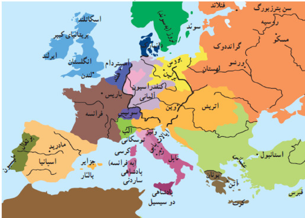
نقشه سیاسی اروپا در ۱۸۵۰ م

۱۳- نقشه‌ی زیر را با نقشه‌ی سیاسی اروپا در سال‌های ۱۹۱۵ - ۱۹۱۸ م، مقایسه کنید و تغییرات آنرا بنویسید.