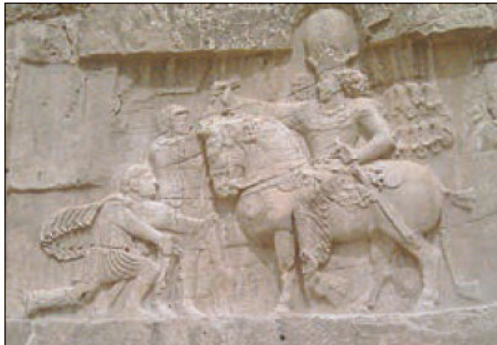
○ نقش برجسته شاپور یکم و والرین، امپراتور اسیر روم - نقش رستم