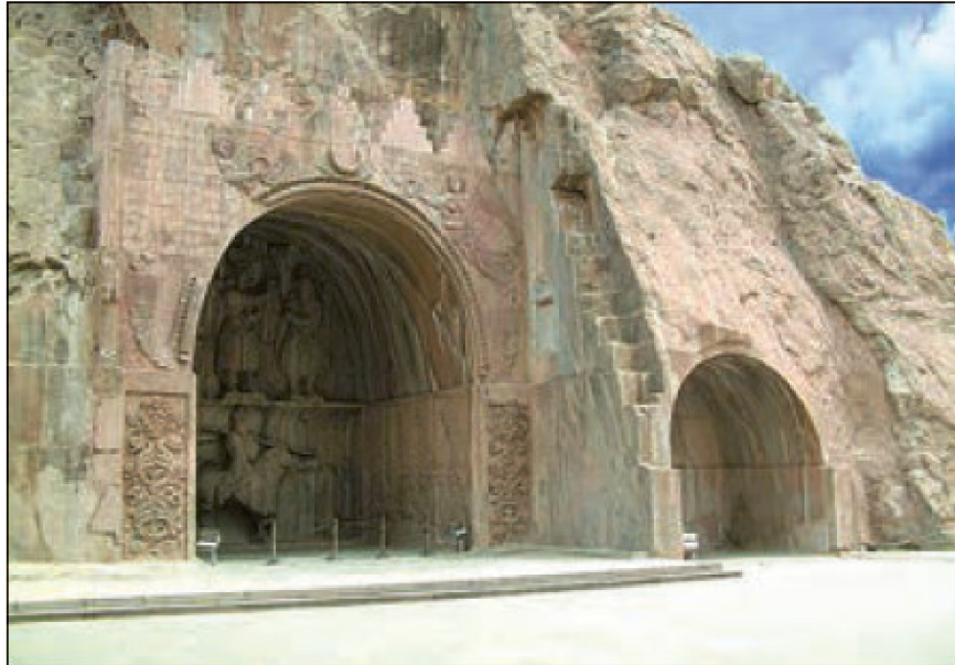
طاق بستان - گرمانشاه