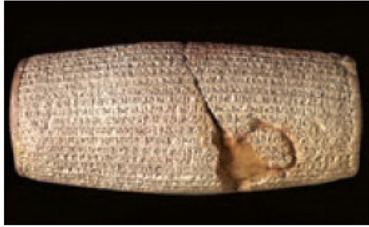
متشور کورش - موزه بریتانیا در لندن

۹- تصاویر زیر را به دقت نگاه کنید و بگویید چرا هریک از آنها منبع دست اول برای دوره‌ی خود هستند.