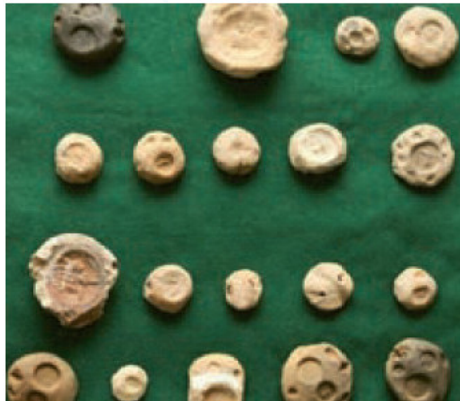
● تعدادی از ۷۳ گل‌مهرة متعلق به دوران ساسانیان که با پیگیری حقوقی دولت در سال ۱۳۹۴ به کشور بازگشت.

۷- به تصویر زیر دقت کنید و بگویید چرا بازگرداندن اشیای تاریخی به کشور، مهم و ارزشمند است؟