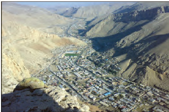
شکل ۸ - ماکو - آذربایجان غربی

۷- به تصاویر مربوط به دو سکونت‌گاه توجه کنید. چه عاملی بر گسترش این سکونت‌گاه اثر دارد؟ این عامل بر نحوه‌ی گسترش این سکونت‌گاه‌ها، چه تأثیری داشته است؟