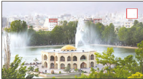
اقل گولی - تبریز - آذربایجان شرقی