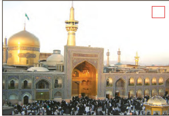
مشهد مقدس - خراسان رضوی