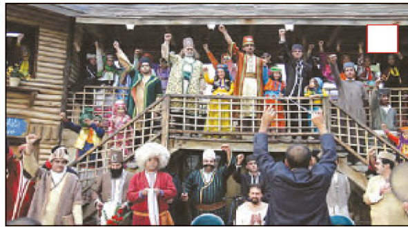
جشنواره اقوام ایرانی - تهران