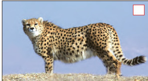
یوزپلنگ ایرانی (آسیایی) - استان سمنان