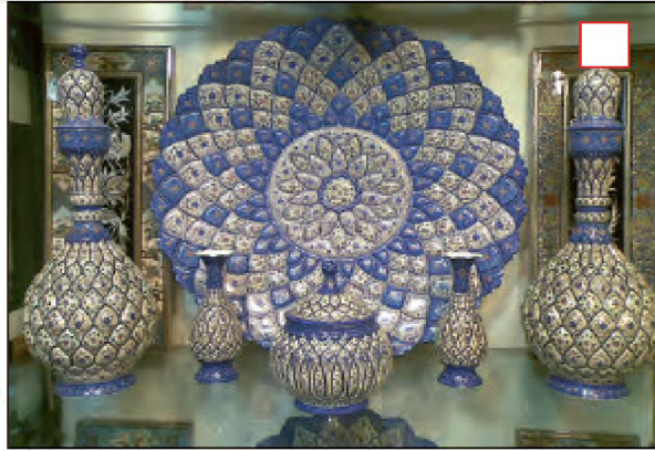
میناکاری - اصفهان

۳- با توجه به جاذبه‌های گردشگری ایران، هریک از تصاویر زیر را شماره‌گذاری نمایید.